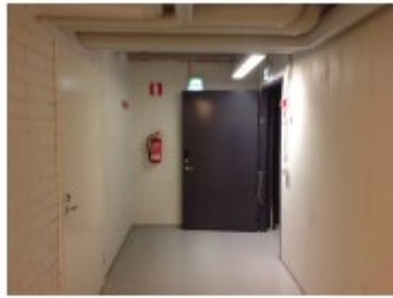
Tekniset tilat kellanikäytävällä