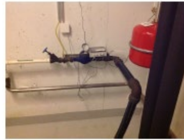
Veden pääsulku lämmönjako- huoneessa