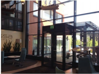
Poistumisopasteet uloskäynneillä ja poistumisreiteillä