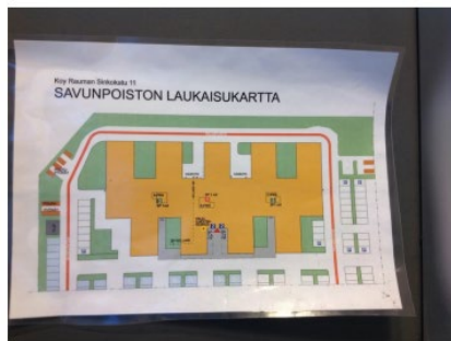
Savunpoiston laukaisukartta paloilmottimen vieressä